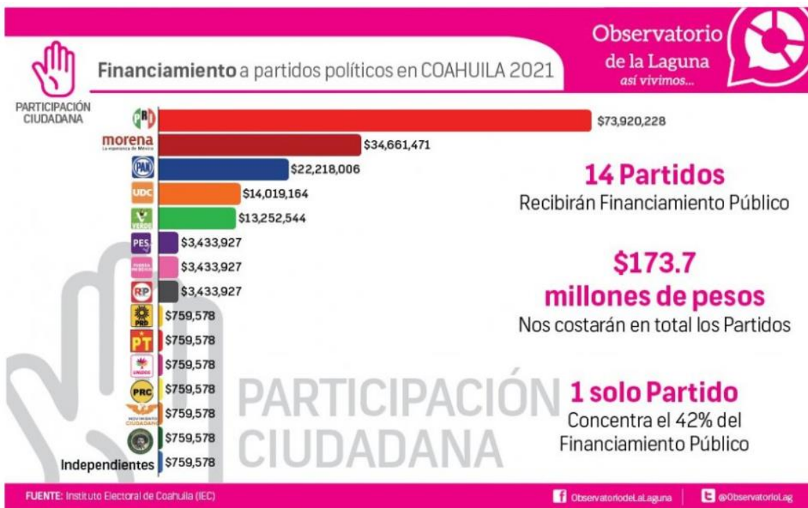
Cuadro 2 Infografía Financiamiento a partidos políticos para el 2021, Extraído de https://observatoriodelalaguna.org.mx/category/indicadores/coahuila-indicadores/coah-participacion-ciudadana/

Por lo que se cuestiona, la manera en la que se ha llevado la elección ha sido realmente democrática, o la saturación de paparruchadas sobre la contingencia sanitaria ha creado un factor de miedo en la población mayor al de su deber cívico.